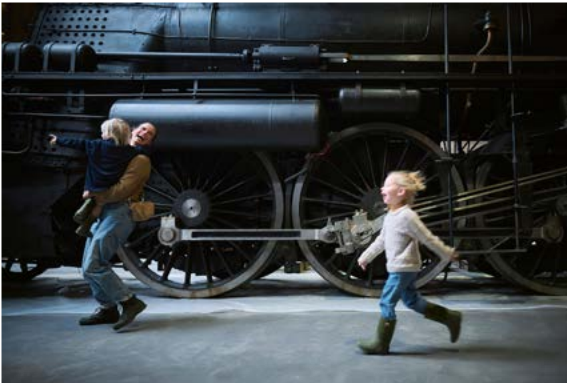
Efterårsferie for store og små på Danmarks Jernbanemuseum.